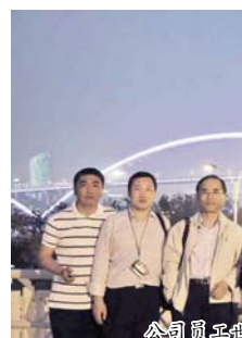
公司员工世博园集体合照

体现出融合城市的概念,而韩文之被直接体现在展馆的外观设计中,韩文特有的几何特征也在建筑上得到了很好的展示。步入馆内,技术和文化融合在一起,展馆二楼,可以通过互